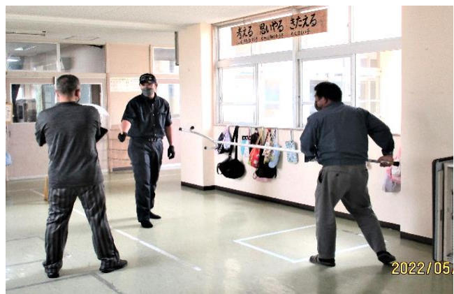
【不審者侵入時の対応訓練の様子】